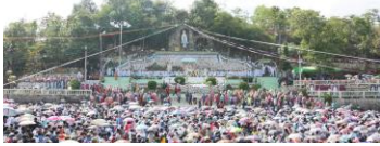
ဂျေရောဗလိုဆုတောင်းပြည့်လုဒ် မယ်တော်ပွဲ